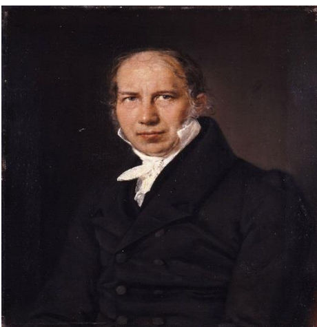
N.F.S. Grundtvig (1783 – 1872)