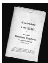
Foreningens kontrabog (checkkonto) med Kjøbenhavns Handelsbank, der er et spring i posteringerne fra april 1941 til januar 1946.